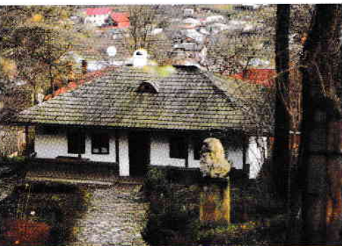
Bojdeuca lui Ion Creangă

Povestea lui Harap-Alb a fost publicată în anul 1877, în revista Convorbiri literare .