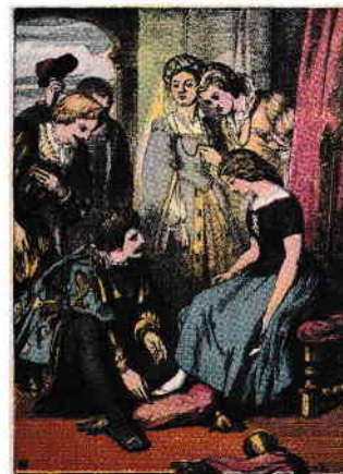
Cenușăreasa – ilustrație din 1865, editura George Routledge & Sons