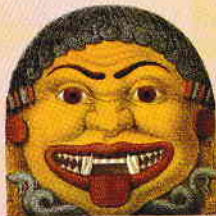
Gorgoneion din epoca arhaică, desen pe teracotă, descoperit sub Parthenon în 1836

Medusa – în mitologia greacă, cea mai cunoscută și singura muritoare dintre cele trei Gorgone (surorile ei se numesc Euryale și Stheno), divinități ale unor forțe malefice. Imaginată cu capul înconjurat de șerpi, Meduza are o privire care împietrește orice muritor. Capul Gorgonelor ( gorgoneion ) apare pe frontonul templelor antice cu funcția de a proteja de spiritele rele. Această ambivalență a binelui și a răului este specifică, în general, miturilor.