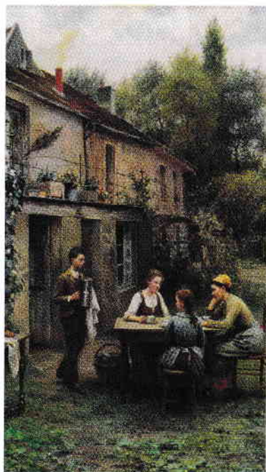
Daniel Ridgway, Cafea în grădină , cca1900

Prezentați-le pe scurt colegilor unul dintre personajele copilăriei de care vă simțiți atașați. Gândiți-vă la poveștile citite, la alte texte literare sau la filme, desene animate și benzi desenate.